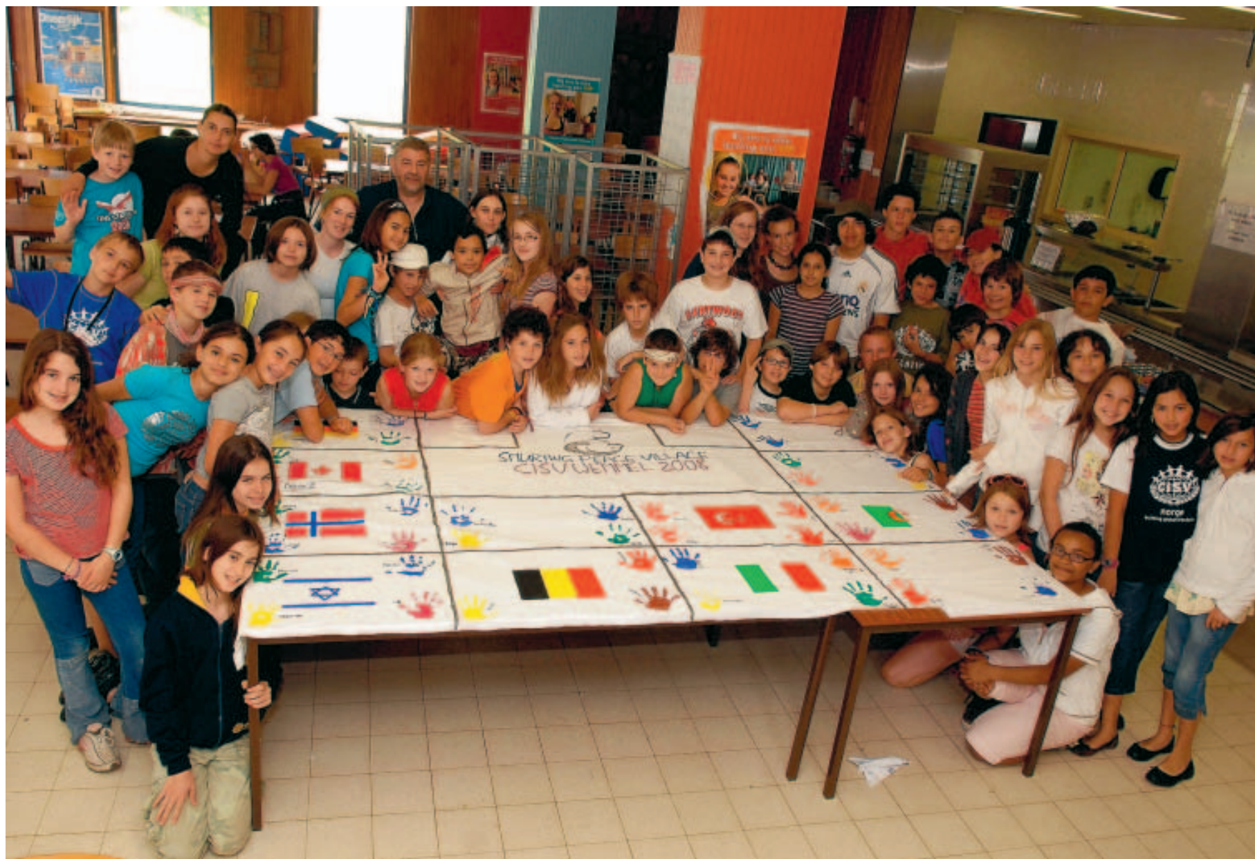
Connaître des gens dans le monde entier et apprendre à les respecter, tel est l'objectif de cette organisation internationale